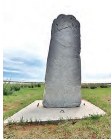
Resim 3. Orhun Kitabeleri (MEB, 2018a, s. 104)