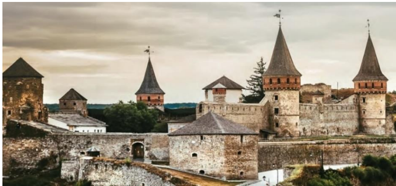
Resim 7. Kamanıçe Kalesi (MEB, 2018c, s.17)

11. sınıf tarih ders kitabında yer alan “Değişen Dünya Dengeleri Karşısında Osmanlı Siyaseti” ünitesinde yer alan anlatıda tarihsel kanıt olarak Kamanıçe Kalesi (Resim 7) coğrafi mekân olarak kullanılmıştır. Bu kullanımda tarih anlatısı coğrafi mekânın ontolojik olarak varlığı ile hem kanıt gösterilmiş hem de mevcut anlatıyı güçlendirmek için kullanılmıştır.