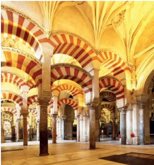
Resim 2. Kurtuba Camisi (MEB, 2018a, s. 153)

Tarih ders kitaplarında coğrafi mekânın bir başka kullanım özelliği de hafıza mekânıdır. Hafıza mekânı coğrafi yeri belli olan geçmişin yaşanmışlığını katmanlı olarak hatırlatan bir mekândır (Nora, 2006). Tarih ders kitaplarında hafıza mekânları, geçmişin yaşanmışlığını ifade etmek için kullanılmaktadır. Bunun için genellikle fotoğraflar kullanılmıştır. Temelde İslami özelliklerin ön planda olduğu görülmekle birlikte tarih konuları itibarıyla dini özellik taşımayan hafıza mekânları da tarih ders kitaplarında yer almaktadır. Aşağıda 9. sınıf tarih ders kitabından hafıza mekânına dair iki örnek yer almaktadır (Resim 2-3).