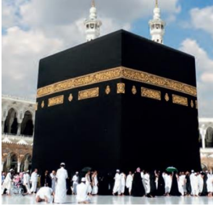
Resim 4. Kâbe (MEB, 2018a, s.140)

Temelde kullanım özellikleri olarak teolojik kutsal mekân ve seküler kutsal mekân olarak iki alt temadan oluşmaktadır. Teolojik kutsal mekân kullanımında İslamiyet vurgusu ön plandadır. Fotoğrafların ve anlatıların birlikte kullanıldığı mekânın bu kullanım biçimi kolektif dini kimliğin bir göstergesi olarak tarih ders kitaplarında yer almaktadır. 9. sınıf ders kitabında yer alan Kâbe (Resim 4) ve Hira Dağı (Resim 5) resimleri teolojik kutsal mekânın örneklerindedir: