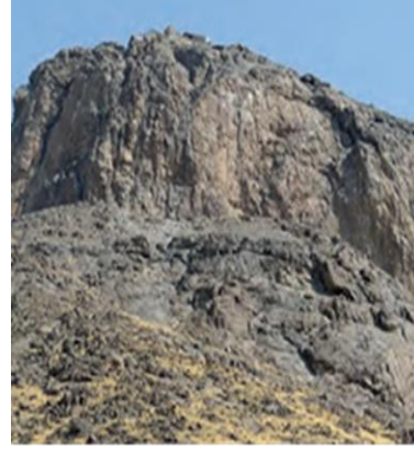
Resim 5. Hira Dağı (MEB, 2018a, s.135)

Tarih ders kitaplarında teolojik kutsal mekân kullanımında siyasi tarih anlatıları da kullanılmıştır. 11. sınıf tarih ders kitabında Kutsal Yerler anlatısında teolojik kutsal mekânın kullanım örneği şöyledir: “Hz. Ömer Dönemi’nde Kudüs, Bizans’tan alındı. Yüzyıllar boyunca Müslümanların egemenliğinde olan Kudüs, Haçlı Seferleri saldırılarına rağmen Müslümanların elinde kaldı. Yavuz Sultan Selim Dönemi’nde Osmanlı topraklarına katılan Kudüs’teki kutsal yerlerin hakları ve ayrıcalıkları Rum ve Ermenilere yeni menşurlarla verilmişti.” (MEB, 2018c, s.98)