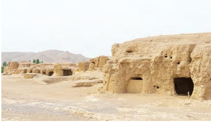
Resim 6. Yarkent Kalıntıları (MEB, 2018a, s. 78)

Tarihsel kanıt olarak coğrafi mekânın kullanımı anlatı içinde metin olarak yer almakla birlikte çoğu zaman da mekânın fotoğrafları kullanılmıştır. 9. sınıf tarih ders kitabında yer alan İpek Yolu anlatısında tarihsel kanıt ve anlatıyı destekleme aracı olarak Yarkent kalıntıları kullanılmıştır (Resim 6):