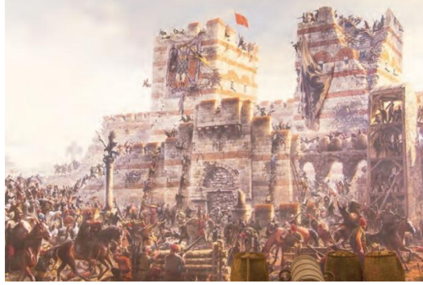
Resim 1. İstanbul Kuşatması (MEB, 2018b, s. 127)

kitaplarında geçmişin öğrencilerin zihninde imgelem olarak inşası için minyatür, gravürler ve temsili resimler kullanılmıştır. Aşağıda yer alan resim 1 aracılığıyla öğrencilerin zihninde İstanbul kuşatmasına dair tarihsel imgelem “imge olarak mekânın kullanılması” ile oluşturulmaya çalışılmıştır.